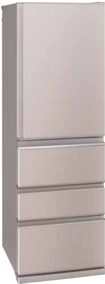
MR-N40E4K シャイングレージュ(C)